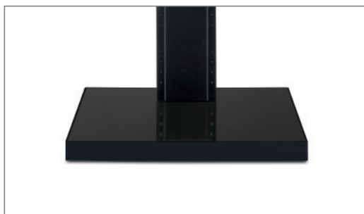
verdeckt angebrachtes Rollenset, Hochglanzoberfläche