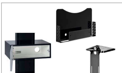
Erweiterbar durch vielfältiges Zubehör

Durch ein vielseitiges Angebot optionaler Zusatzartikel lässt sich das System auch auf spezielle, individuelle Anforderungen problemlos anpassen.